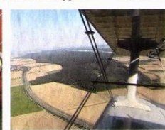
Ein Blick aus der Antonow über das ländliche Salzgitter mit der A 39. Das Flugzeug sei zu DDM-Zelten vor allem für Transporte genutzt worden, sagt Pilot Uli Reinecke.