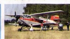
Die Antonow (Baujahr 1958) stammt aus der DDR, wurde von der Nationalen Volksarmee genutzt. Sie gehörte der Interflug. Nach der Wende kam sie in private Hände.