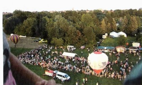
Die Heißluftballone heben ab; hier der Blick aus einem Ballon aufs Veranstaltungsgelände.

Eine Bilderserie von den Flugtagen finden Sie auf der nächsten Seite.