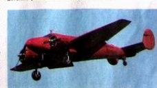
Eine knallrote Beech 185 zieht ihre Kreise am Himmel über dem Flugplatz-Gelände. Das zweimotorige Flugzeug aus den 60ern stammt aus Nordamerika.